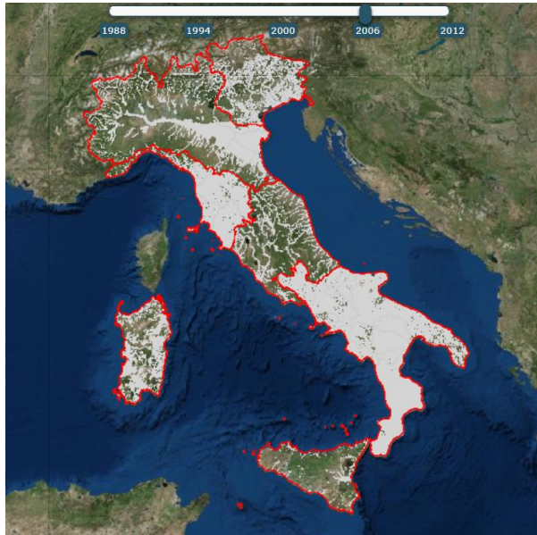
Valutazione Preliminare del Rischio di Alluvione - 2019

La Direttiva Alluvioni (articoli 4, 5 e 6) prevede l'elaborazione di Mappe per la Valutazione Preliminare del Rischio di Alluvioni e Mappe di Pericolosità e Rischio di Alluvioni